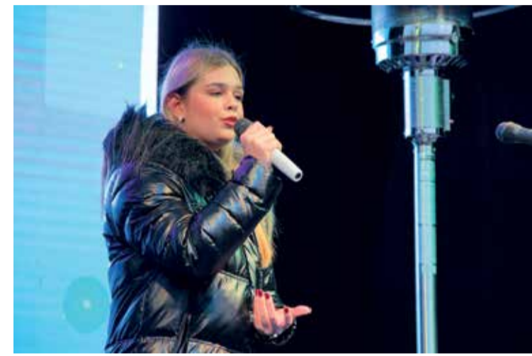
Az elmúlt hétvégén véget értek az Etele téri Újbudai Advent színpadi programjai, de a karácsonyi forgatag még egészen december 24-éig vár mindenkit.

Bár néha az idő borús volt, néha mínuszokba fordult a hőmérséklet, az ünnepi hangulat nem maradt el az Etele téren, a fellépők gondoskodtak róla, hogy ismét felcsendülhessenek kedvenc slágereink és karácsonyi dalaink.